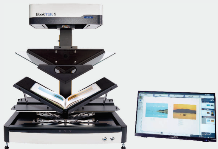
Scannen von hochglänzenden Vorlagen mit V-Glasplatte