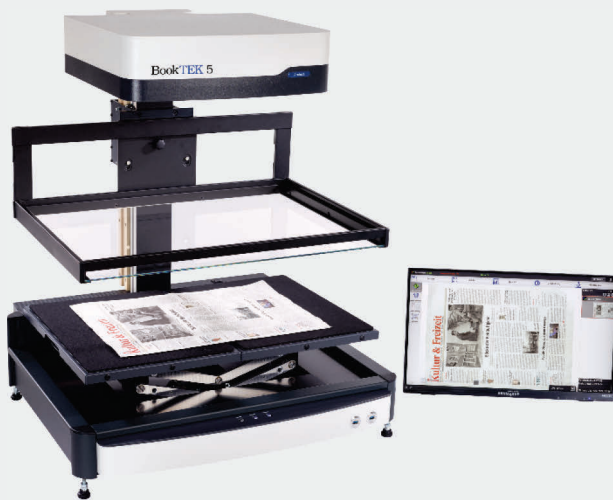
Scannen von Zeitungen bis A2 mit flacher Glasplatte

Die Buchwippe ermöglicht perfekte Scans bei gleichzeitiger Schonung der Buchbindung. Die V-Glasplatte kann mit einfachen Handgriffen entfernt werden. Je nach Bedarf kann der BookTEK nun mit flacher Glasplatte oder ganz ohne Glasplatte verwendet werden.