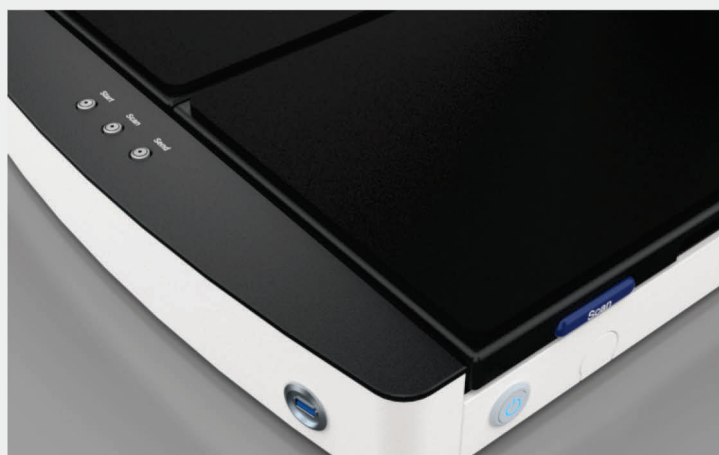
USB 3.0 Anschluss zum Speichern der Scans auf jedem USB-Stick

Bis zu fünf Jahre Erweiterte Garantie und kostenlose Ersatzteile